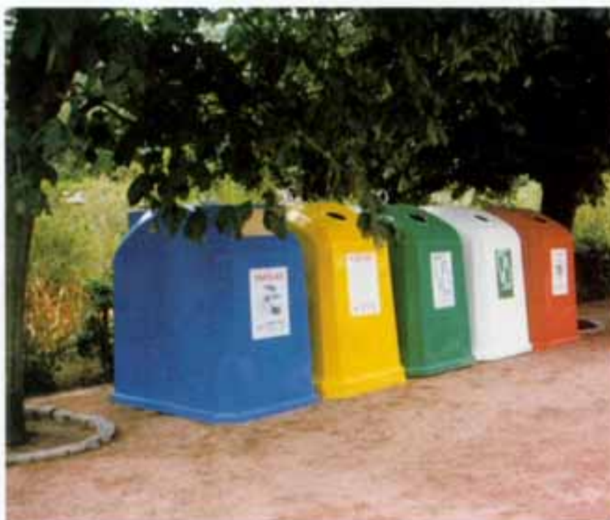
Figura 2 – Contentores para recolha de papel, plástico, vidro e latas; exposição «Design para a Cidade», Fundação de Serralves, Porto, 1991

Diga em que consiste a avaliação de custos.