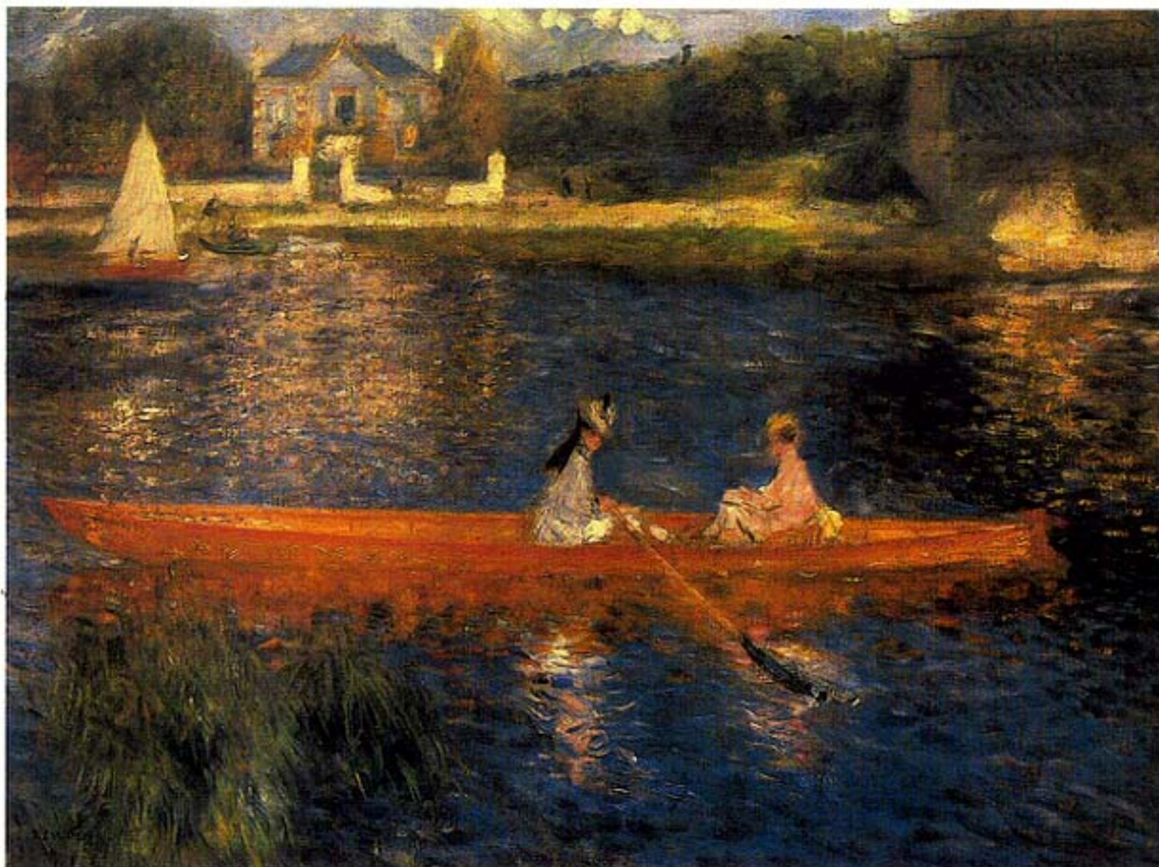
Figura 2 – A. Renoir, O Barco a Remos , óleo sobre tela, Galeria Nacional, Londres

Auguste Renoir, pintor impressionista, é uma referência do século XIX. O seu contributo foi decisivo e expressou-se através de uma refinada técnica que serviu de base para a plena inovação plástica e para a diversidade de temas explorados, nos quais as ambiências do Sena foram bem representadas.