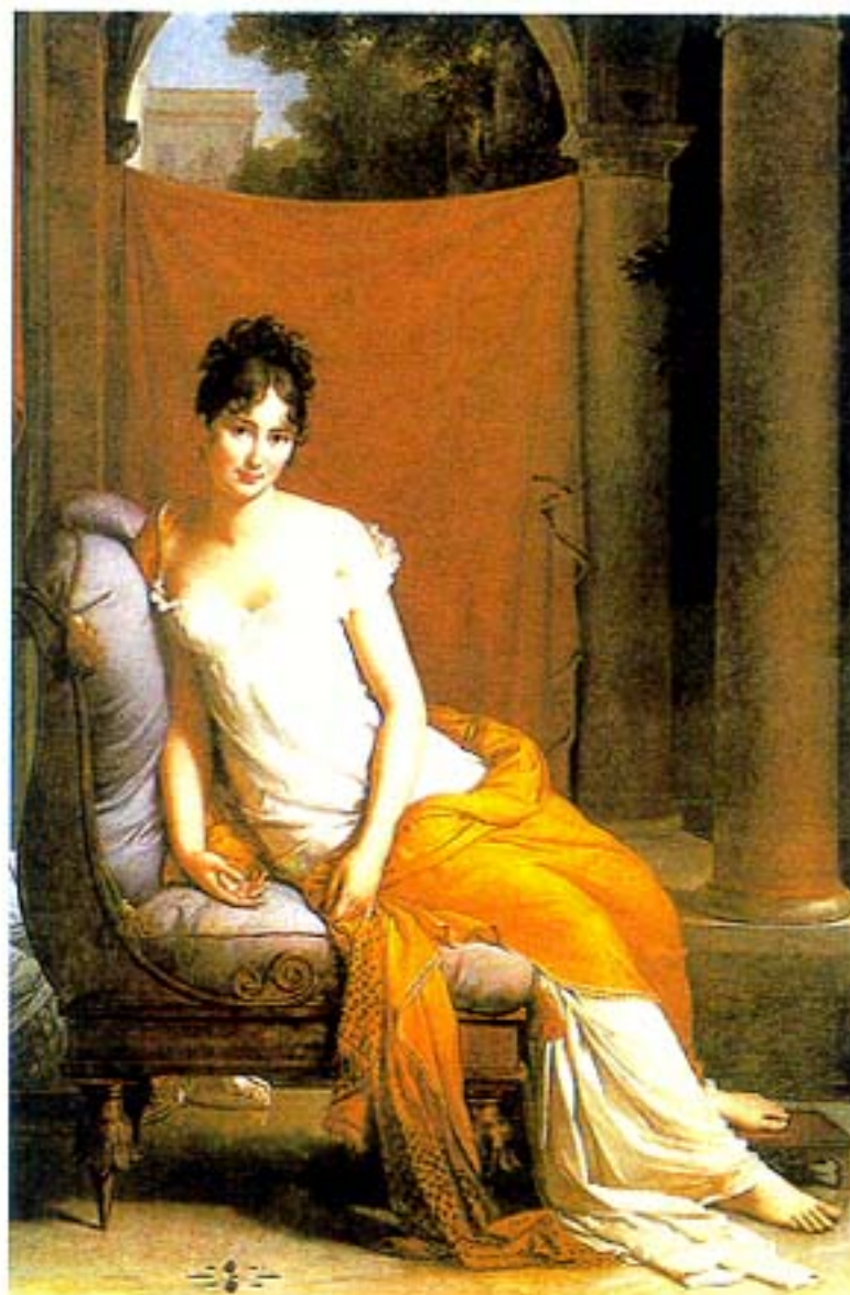
Figura 1 – F. Gérard, Madame Récamier , 1802, óleo sobre tela, Museu Carnavalet, Paris