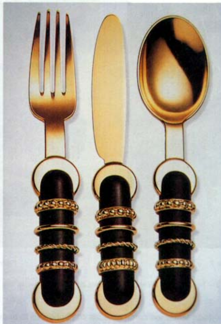
Figura 4 – Matteo Thun, talheres «Homenagem a Madonna», 1985

Comente esta afirmação, tendo em conta as várias posturas antifuncionalistas surgidas ao longo do século XX.