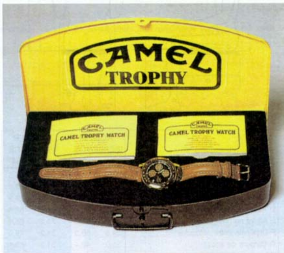
Figura 2 – Relógio da série Trophy's Adventure , da Camel

1.2. Explique o papel do «design de comunicação» no actual contexto socioeconómico.