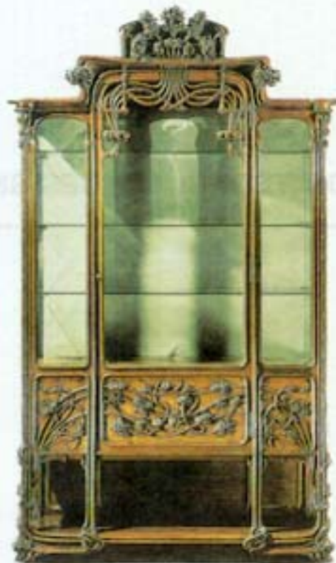
Figura 1 – V. Epaux, Vitrine , 1900