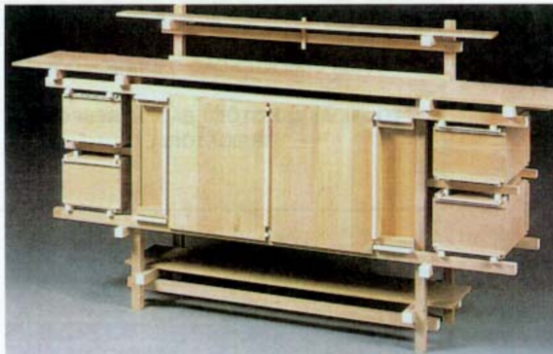
Figura 2 – G. Rietveld, Sideboard , 1919

Os objectos representados nas figuras 1 e 2 foram concebidos em épocas que distam entre si apenas cerca de duas décadas.