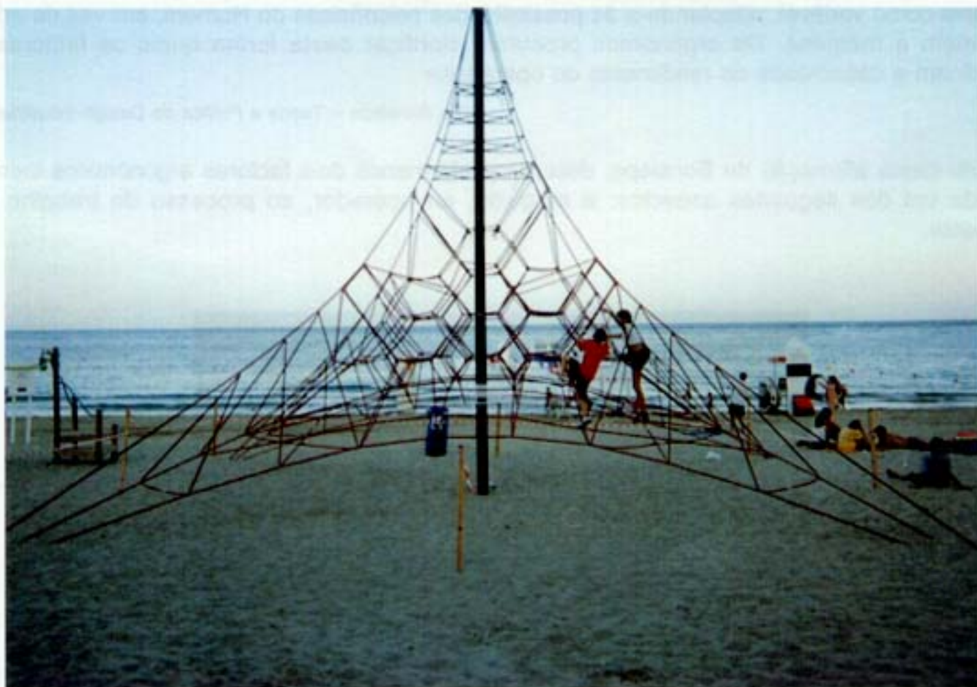
Figura 3 – Jogo de praia com eixo de aço e estrutura de corda