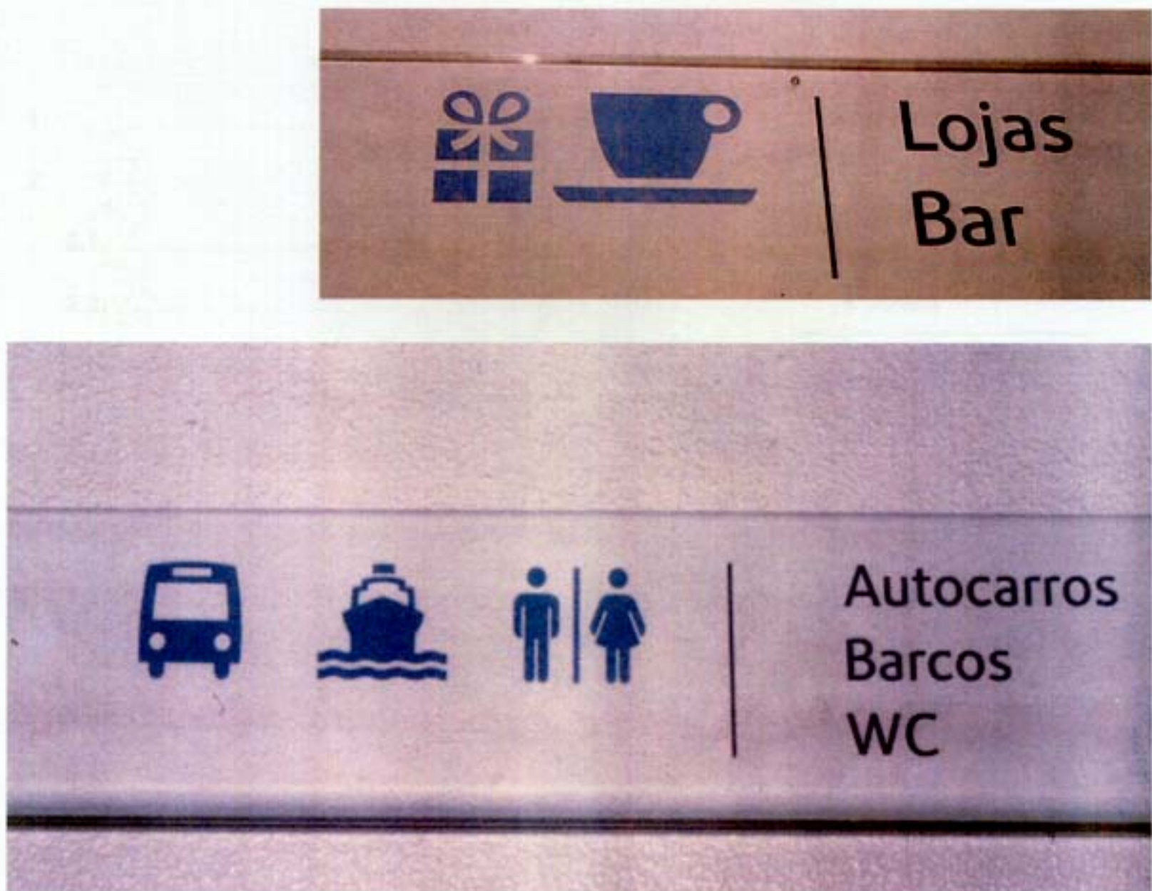
Figura 4 – Exemplo da sinalética utilizada no metropolitano de Lisboa

Segundo Bruno Munari, em qualquer projecto, após a definição do problema, há que ter em conta as suas componentes: função, materiais, forma, estrutura, psicologia, ergonomia e economia.