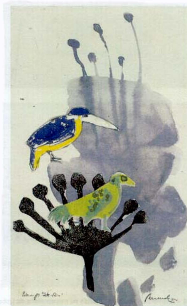
Figura 5 – Júlio Resende – Estudo preparatório para painel cerâmico do metropolitano de Lisboa, estação do Jardim Zoológico