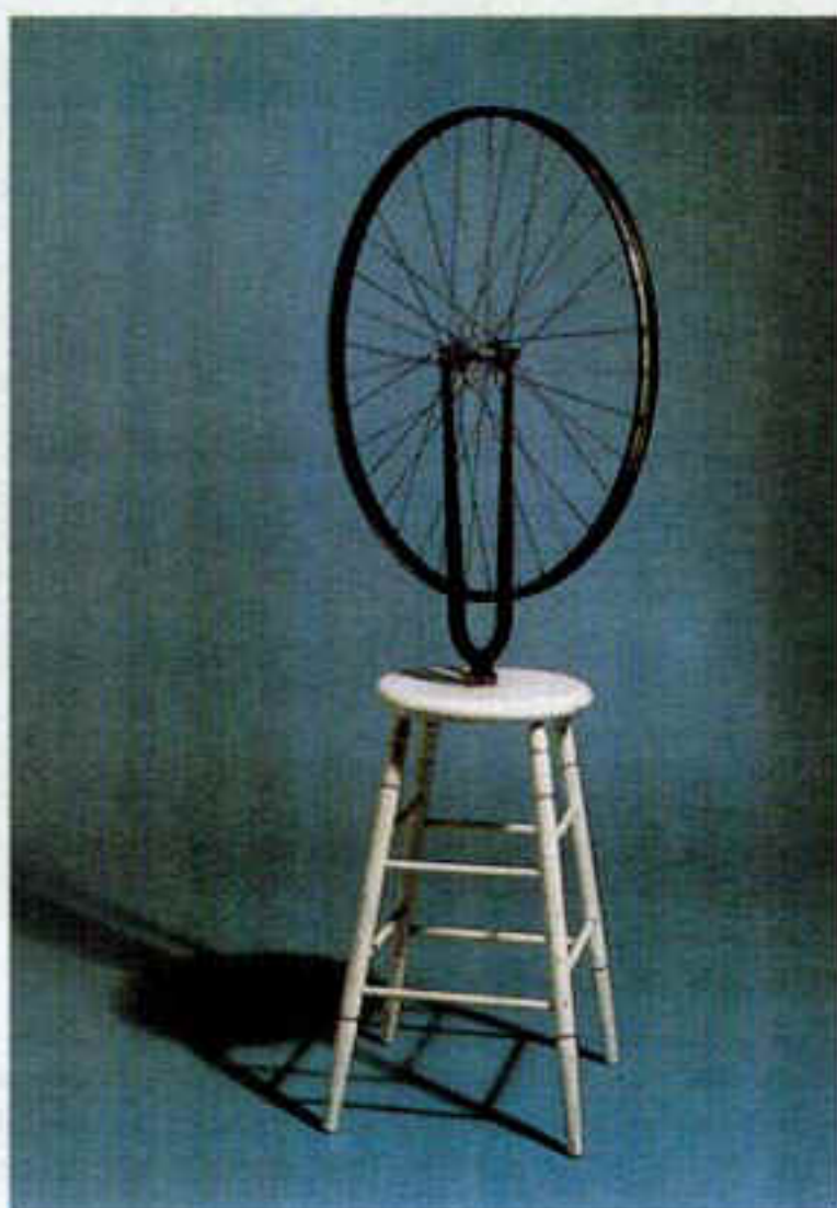
Figura 1 – M. Duchamp, Roda de bicicleta , ready-made, 1913, Philadelphia Museum of Art